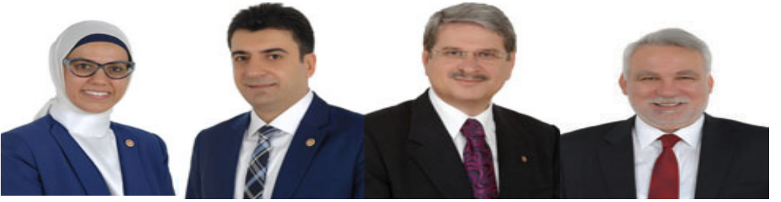
Ravza KAVAKÇI KAN İstanbul